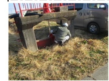
R7施工実績① 給水管工事の立会い