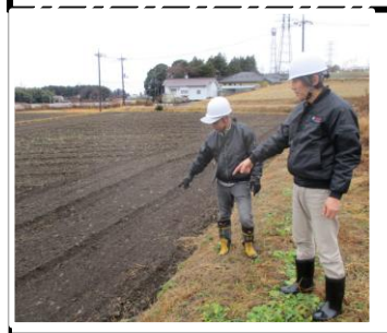
12月14日 施設の点検・機能診断