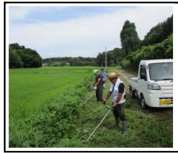
7月28日 農用地の草刈り